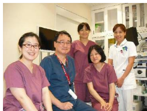
内視鏡室スタッフ