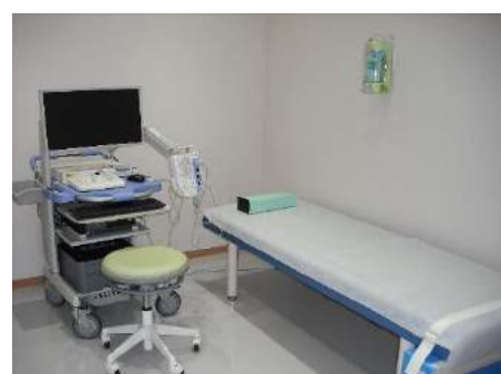
神経伝導速度測定器

小千谷病院検査科を紹介します。旧小千谷病院と魚沼病院で行なっていた一般的な検査項目を網羅した検査科の業務内容となっています。検査種類には生化学的検査、血液学的検査、一般検査、細菌学的検査、生理学的検査、病理学的検査を行なっています。患者 ID を基本にデータ処理を行なっていますし、全てがバーコード処理されるような仕組みになっています。1階中央採血室、生理検査室では下肢エコー、神経伝導速度検査等、開業医の皆様からもご依頼を頂いております。検査もここでを行なっております。生理学的検査は患者さんに来院して頂く必要がありますので要予約となりますが、少しでも、地域連携業務に役立てるよう協力したいと考えております。